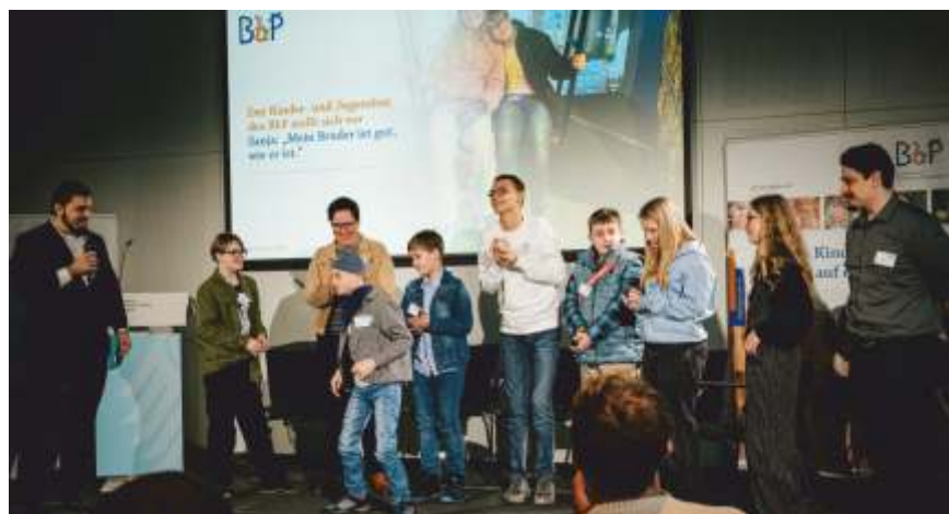
Der Kinder- und Jugendrat des BbP hat offiziell die Handreichung ans Ministerium übergeben und die Veranstaltung gestaltet.